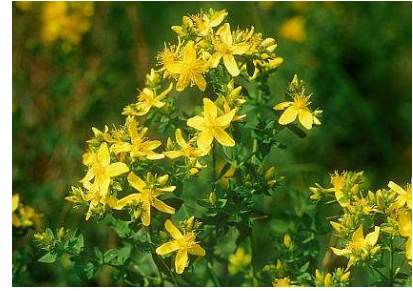
Iperico o erba di San Giovanni